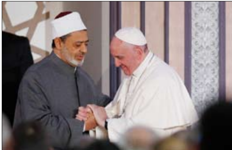
El Papa Francisco saluda a Ahmed el-Tayeb, el gran imán de Al-Azhar.

Un momento esperado del viaje fue su visita a la Universidad de Al-Azhar, principal referente teológico y educati-