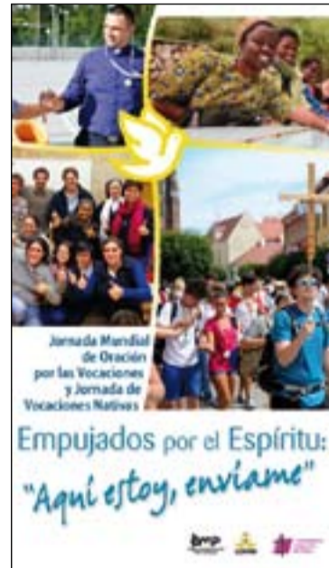
Cartel oficial de la Jornada.