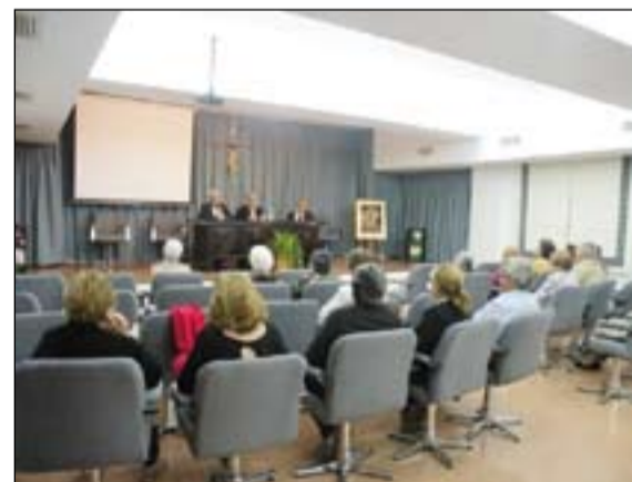
Uno de los momentos de la XVIII Semana de reflexión y diálogo en la parroquia de San Roque.